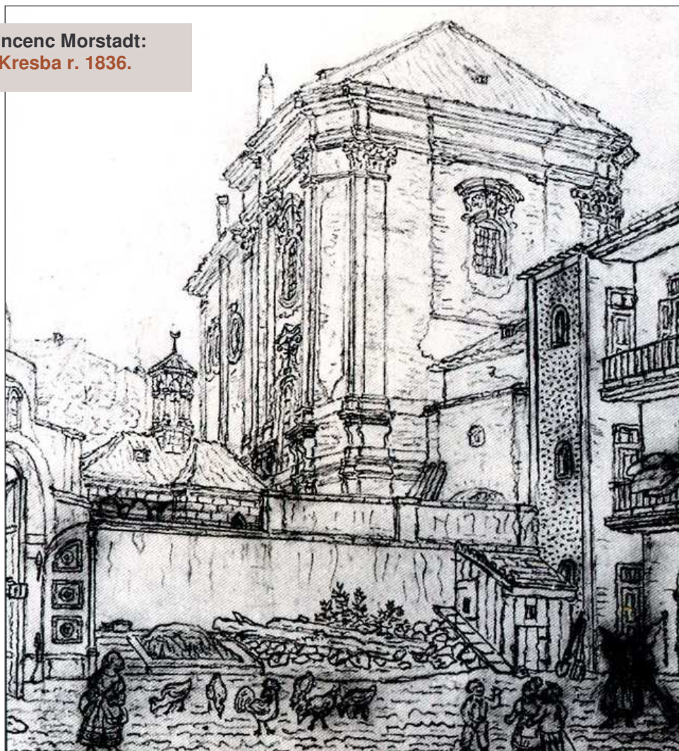
Vincenc Morstadt: Kresba r. 1836.

V josefínské době byl klášter zrušen, budovy byly předány náboženskému fondu a pronajaty vojenskému eráru. V roce 1898 areál získalo České vysoké učení technické .