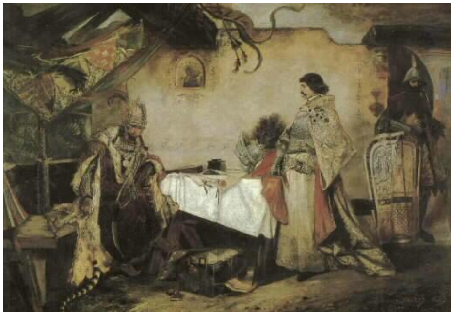
Setkání Jiřího z Poděbrad s Matyášem Korvínem po bitvě u Vilémova

Při příležitosti jeho padesátých narozenin objednala u něj pražská městská rada výzdobu klenby a stěn vestibulu Staroměstské radnice a k šedesátým narozeninám byl jmenován pražským měšťanem a byl mu udělen titul inspektora kreslení na měšťanských školách a rádce v dílech uměleckých. Poslední dvě desetiletí svého života prožil existenčně zajištěn a všeobecně vážen.. Na jaře roku 1913 namaloval své poslední dílo - akvarel „Svatý Václav“. Za svého života byl uznáván spíše jako kreslíř a dekoratér, jeho olejomalby byly doceněny až ve 20. století.