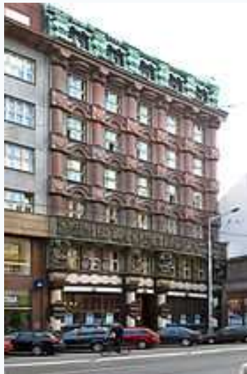
Legiobanka v rondokubistickém slohu

Významnou roli v Gočárově tvorbě hraje také urbanismus . Jeho zásadním dílem je moderní centrum Hradce Králové, kde na počátku dvacátých let postupně zpracoval územní plán města, vytvořil regulační plán nábřeží, výstavbu v Labské kotlině, školní bloky a střed města (dnešní Ulrichovo náměstí). Plány výstavby zahrnovaly rovněž systém vnějšího dopravního okruhu s radiálami směřujícími do centra města, mezi nimiž se střídají obytné čtvrti s plochami zeleně. Bez velkorysé podpory starosty Ulricha by Gočár nemohl plně nerozvinout své urbanistické schopnosti a bez Gočára by nebyl moderní Hradec Králové, který je dodnes městem vynikajícím svými kvalitami urbanistického konceptu i architektonického detailu.