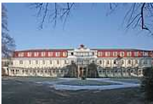
Lázeňský pavilon v Bohdanči

Gočárův pavilon v lázních v Bohdanči byl otevřen v květnu 1913. Přízemí s předsunutou krytou kolonádou je určeno k umístění všech zařízení potřebných k léčení rašelinou - kabiny s vanami pro slatinné koupele, odpočívadla, čekárny, místnosti pro masáže. Kolonáda s arkýřovými výstupky ústí do vestibulu a dnes navazuje na další lázeňské budovy. K zásadní změně došlo v roce 1926, kdy bylo pavilonu přistaveno druhé patro a získány další ubytovací prostory, zároveň však došlo k narušení původní kubistické architektury. Pavilon dodnes slouží původnímu účelu v Léčebných lázních.