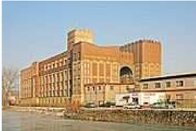
Budova Automatických mlýnů v Pardubicích

Ranné období jeho činnosti lze sledovat od roku 1908, kdy se osamostatnil a již v letech 1909-1910 realizoval první větší projekty na př. areál Winternitzových automatických mlýnů v Pardubicích na pravém břehu řeky Chrudimky. Při pohledu z protější strany řeky působí tato monumentální stavba jako romantický hrad a dodnes tvoří zdejší významnou dominantu.