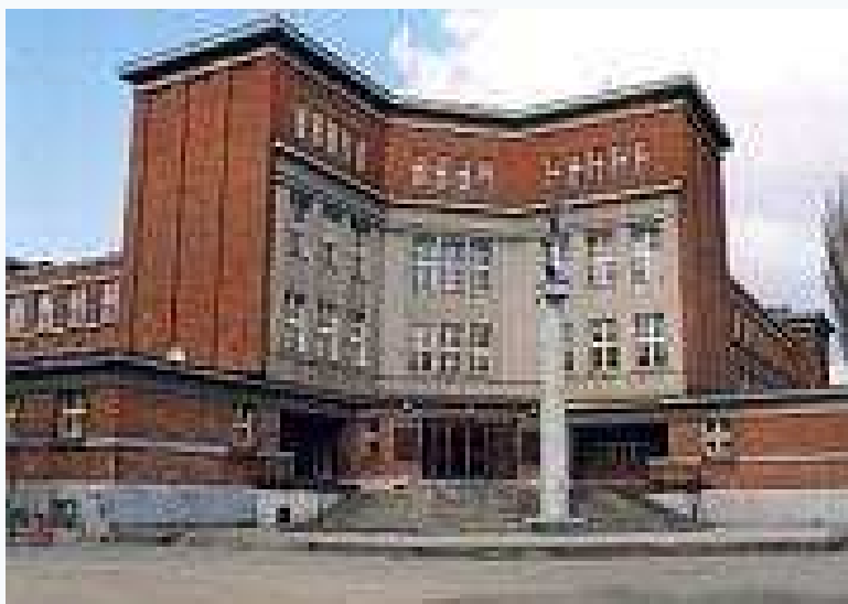
Gymnasium v Hradci Králové

Když ve světě moderní architektury nastoupil konstruktivismus (zdůrazňoval technickou dokonalost, krásu hmoty a účelnost stavby) a funkcionalismus (forma vždy vyplývá z funkce, skutečnou krásu najdeme ve funkčnosti budovy, nikoli v ozdobách), opustil Gočár v polovině 20. let dekorativismus a jeho další projekty již jsou těmito novými směry ovlivněny. Postupně tak byly v Hradci Králové realizovány stavby Koželužské školy (1923 - 1924), budova Agrobanky (1922 - 1923), úprava průčelí starších domů dnešního Masarykova náměstí s instalací sochy T. G. Masaryka (1926 - 1927), budova Rašínova státního gymnázia se sochou "Vítěze" od J. Štursy před vchodem (1923 - 1926).