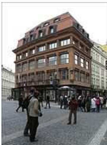
Dům u Černé Matky Boží

Gočárův pavilon v lázních v Bohdanči byl otevřen v květnu 1913. Přízemí s předsunutou krytou kolonádou je určeno k umístění všech zařízení potřebných k léčení rašelinou - kabiny s vanami pro slatinné koupele, odpočívadla, čekárny, místnosti pro masáže. Kolonáda s arkýřovými výstupky ústí do vestibulu a dnes navazuje na další lázeňské budovy. K zásadní změně došlo v roce 1926, kdy bylo pavilonu přistaveno druhé patro a získány další ubytovací prostory, zároveň však došlo k narušení původní kubistické architektury. Pavilon dodnes slouží původnímu účelu v Léčebných lázních.