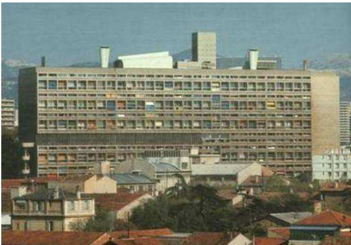
Kolektivní dům v Marseille

K první velké realizaci jeho myšlenek došlo až po 2. světové válce, kdy byl pověřen stavbou velkého obytného bloku v Marseille. Tato stavba nazvaná „ Unité d'habitation “ (Kolektivní dům) byla realizována v létech 1946 - 1952 a představuje jednu z nejpozoruhodnějších staveb 20. století, a to jak z hlediska výtvarné formy, tak z hlediska sociálního programu. Zahrnuje 337 převážně dvoupodlažních bytů ve 23 různých typech. Osmým a devátým podlažím probíhá obchodní ulice, na střešní terase jsou umístěny jesle, školky, tělocvična a bazén. Dům je tedy sám o sobě městem, střecha přejímá úlohu náměstí. Podobné budovy pak byly v poněkud redukované podobě ještě postaveny v několika dalších městech.