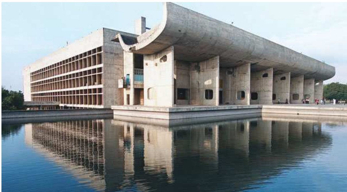
Chandigarh - Soudní palác

Ve téže době byly ve Francii realizovány dvě jeho významné stavby – kostel Notre-Dame-du-Haut v Ronchamp a klášter La Tourette. První stavba (1951-55) zcela opouští jeho rané zásady o racionalitě. Skořepina střechy je vytvořena ze dvou rámců a obalu; nosnou část tvoří nezávislé zdi oddělené úzkým meziprostorem od střechy a pilíře ze železobetonu. Jižní zeď je silnější a je více nakloněna než ostatní.